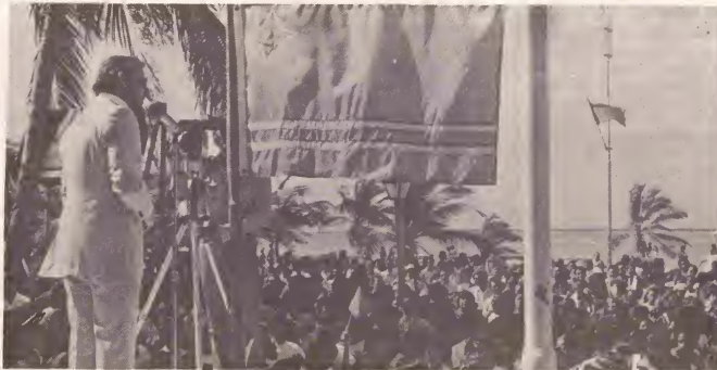
Miles di muchanan di school a participa den e aubade dilanti Bestuurskantoor ariba 18 di Maart ultimo pa rendi homenage na himno y bandera di Aruba. Dirigiendo palabra ta Consehero General, Sr. Betico Croes.